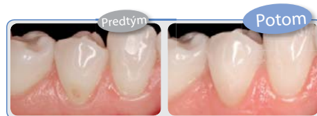
Rekonštrukcia V. triedy pomocou Filtek™ Ultimate Flowable (odtieň A3.5).